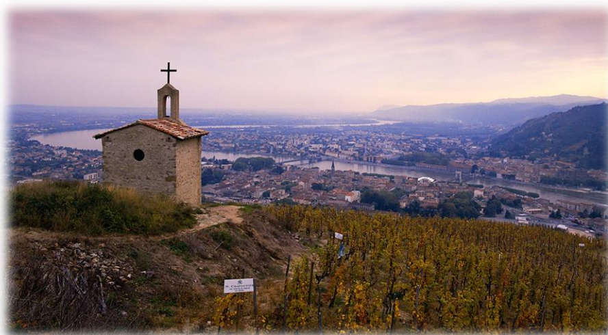
Paul Jaboulet – La Chapelle - Côtes du Rhône